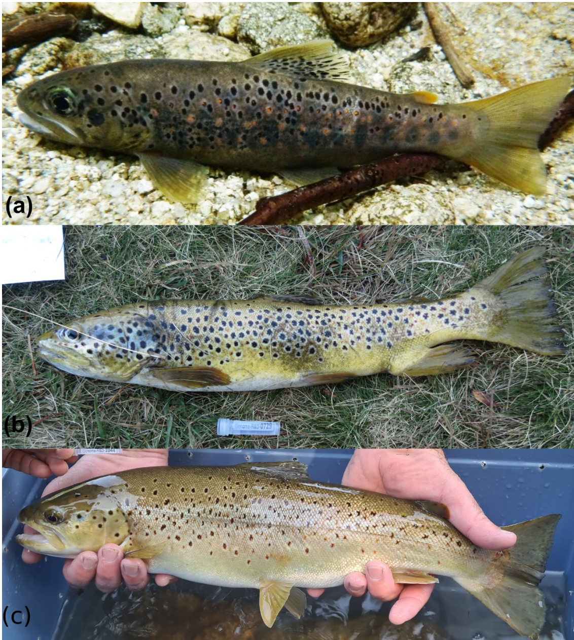
Figure 3 : Illustration du polymorphisme de la truite commune. (a) truite sauvage de Corse, © Stéphane Muracciole ONF. (b) truite domestique des Pyrénées orientales, © Adeline Héroult Fédération de pêche 66. (c) truite sauvage d'Ardèche, © Florent Nicodème, Fédération de pêche 07.

Cette situation s'explique par la grande diversité biologique, morphologique et écologique des populations de truites, dont la mise en valeur partielle pour la taxonomie correspond à l'application de critères de délimitation qui peuvent se contredire. Les différentes populations ou taxons correspondent à une gradation de l'ancienneté de leur divergence, de plus de 3-4 millions d'années (Ma) pour la divergence de S. trutta avec d'autres lignées telles que S. marmoratus , ou S. ohridanus et S. obtusirostris , à moins de 1 Ma, voir moins de 20 000 ans pour la