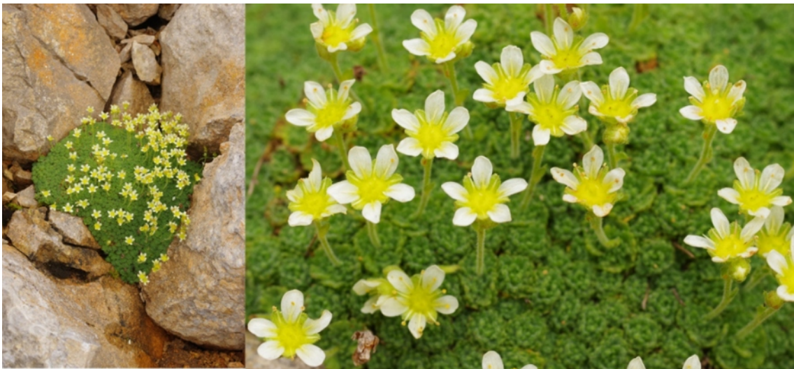
Figure 4 : Le saxifrage du Dauphiné, Saxifraga delphinensis , Grand Veymont, Vercors.

delphinensis par son découvreur, le curé de Villard-de-Lans (Ravaud, 1885), le saxifrage du Dauphiné est ensuite passé en sous espèce de S. exarata (Kerguélen, 1993), pour finalement revenir au rang d'espèce (Garraud 2004 ; Tison et Foucault 2014) et cela sans étude ad hoc . Cependant, si Baumel et al. (2023) ont confirmé l'existence de son originalité génétique, ils ont aussi révélé une introgression entre S. delphinensis et le saxifrage sillonné, S. exarata , et entre S. delphinensis et le saxifrage musqué S. moschata . Tandis que le génome des plastes, à hérédité maternelle, établit un lien de parenté entre le saxifrage du Dauphiné et S. vareydana , taxon endémique de Catalogne, les marqueurs nucléaires (à hérédité biparentale et sujets à la recombinaison génétique), soutiennent une contribution forte de S. exarata au génome de S. delphinensis . L'origine et la diversité génétique du saxifrage du Dauphiné sont donc déterminées par la rencontre, et la recombinaison, d'une lignée ancestrale, probablement d'origine ibérique avec la lignée de S. exarata dans les Alpes. La fréquence de leur introgression et leur différenciation morphologique, qui reste prononcée en sympatrie même, permettent de penser que ces saxifrages évoluent dans un syngaméon.