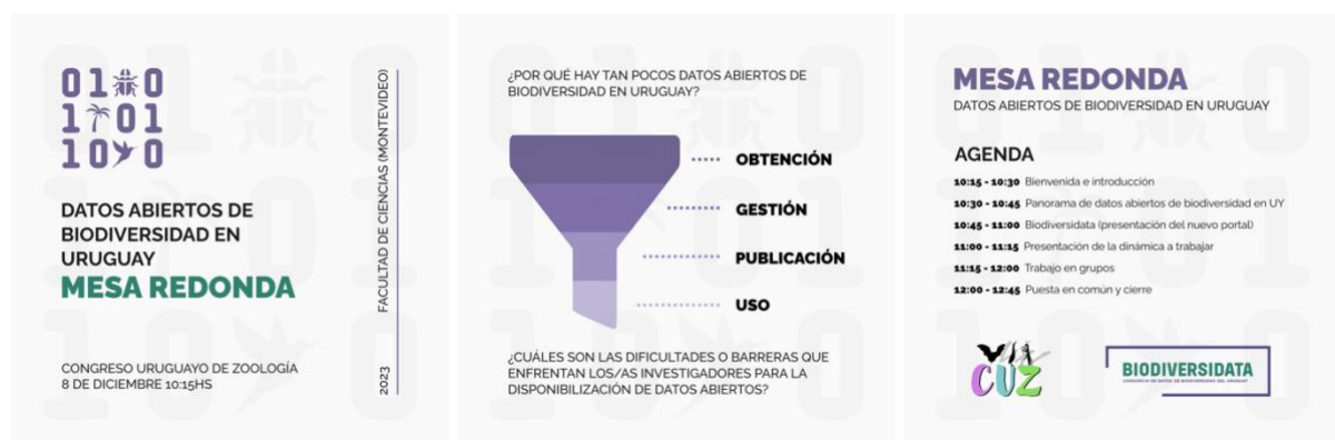
Figura 1. Afiches utilizados para la convocatoria a la mesa redonda "Datos abiertos de biodiversidad en Uruguay" en el marco del VII Congreso Uruguayo de Zoología.

La mesa se llevó a cabo el 8 de diciembre de 2023 en la Facultad de Ciencias de la Universidad de la República, en el marco del VII Congreso Uruguayo de Zoología, celebrado en la ciudad de Montevideo (Figura 1). La participación fue abierta a todo público (no sólo a las personas inscriptas al congreso). En total participaron 18 personas (7 varones y 11 mujeres) con distintos perfiles, desde estudiantes de grado y posgrado hasta investigadores de carrera temprana y consolidados.