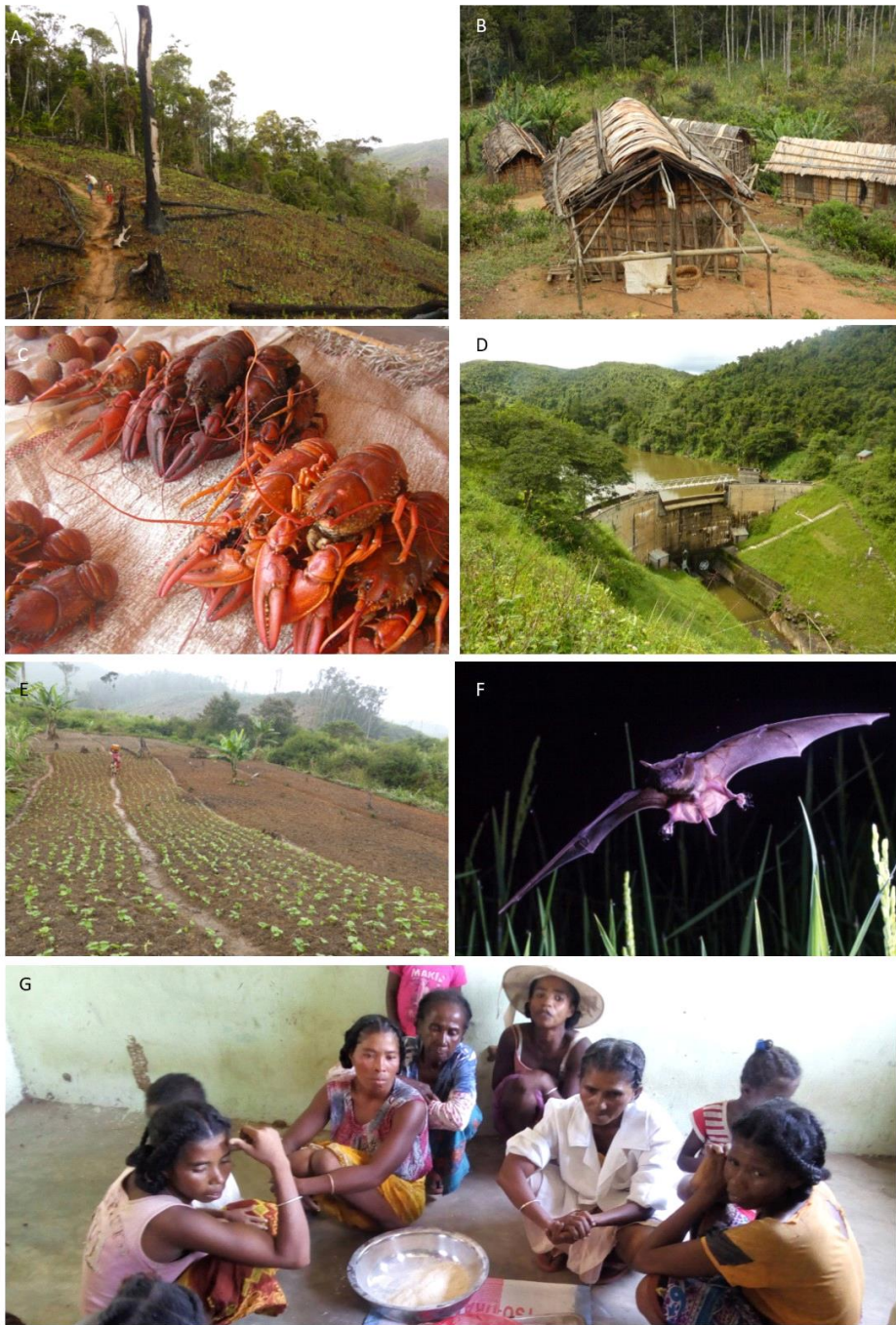
Figure 1 : A, Tavy en bordure du Parc National de Zahamena. B, C, Les Malgaches ont toujours utilisé les produits récoltés dans la forêt (y compris les matériaux de construction et de toiture et les aliments tels que les écrevisses d'eau douce). D, Payment for Ecosystem Services Schemes, où les utilisateurs d'hydroélectricité ou les exploitants de barrages paient les agriculteurs en amont pour maintenir la forêt et réduire l'envasement, pourrait contribuer à l'avenir au financement de la conservation des forêts à Madagascar. E, Les interventions de micro-développement telles que la culture améliorée des haricots peuvent être populaires et apporter des bénéfices mais ont eu tendance à ne pas entraîner une transformation significative des systèmes agricoles. F, Les écosystèmes fonctionnels peuvent apporter des avantages; cette chauve-souris à lèvres ridées est antérieure aux parasites des rizières. G, Les communautés de l'ouest de Madagascar explorent le potentiel d'une collaboration avec des sociétés cosmétiques internationales intéressées par les fruits du baobab; un produit à haute valeur potentielle leur permettant de tirer profit des arbres endémiques. Madagasikara Voakajy, Julia P.G. Jones, Mahesh Poudyal, Adrià López-Baucells.